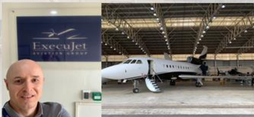
Engenheiro e gestor RT da empresa, Paulo, executando pré compra e preparando aeronave Falcon 900EX para VTI pelo designado da ANAC (PCA), em Lanseria, na África do Sul.