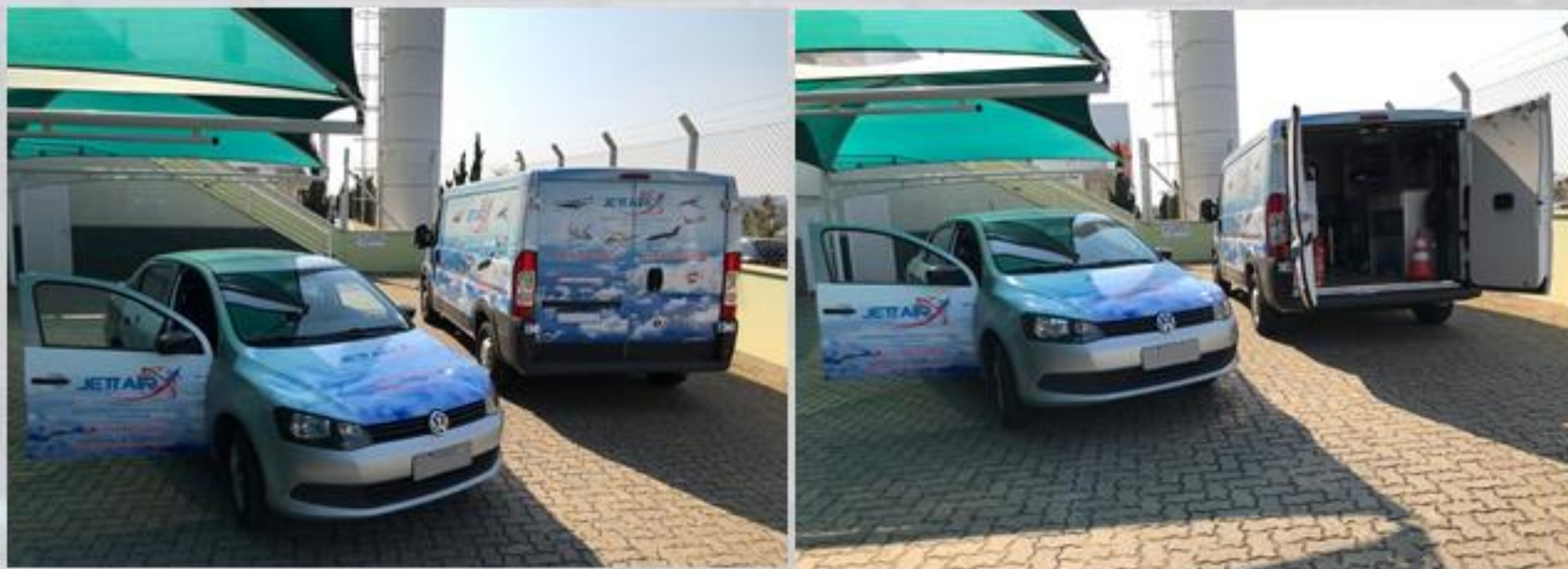
JETT X MOB ONE e JETT X MOB 2 disponíveis para pronto atendimento

A missão da JETT AIR X é a de tornar as logísticas da aviação de nossos operadores disponíveis pelo maior período de tempo possível, e um diferencial nosso é o de trabalhar no sistema “around the Clock Service”. Para isso, contamos com uma frota de veículos que utilizamos nos multi-atendimentos à nossos clientes! Dentre eles, destaque para nosso JETT X MOB ONE , no qual carregamos sob rodas uma estrutura com amplo ferramental e materiais para utilizarmos nos atendimentos técnicos!