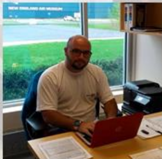
Tayvan - CTM